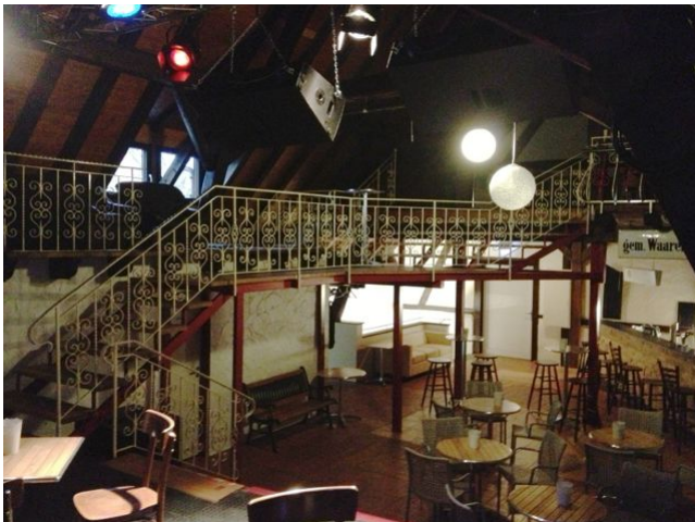
Blick von der Bühne